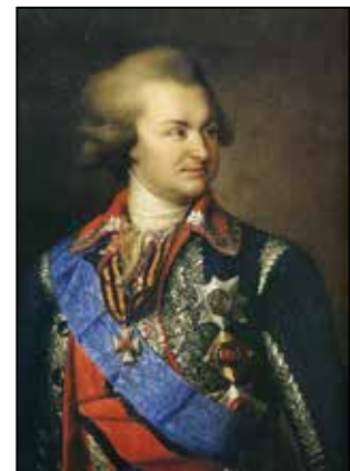
გრიგოლ პოტიომკინი (1739-1791)

ტრაქტატი – საერთაშორისო ხელშეკრულება, შეთანხმება, სადაც შეტანილია გარკვეული პირობები, რომლის დაცვა სავალდებულოა ტრაქტატის დამდები მხარეებისთვის.