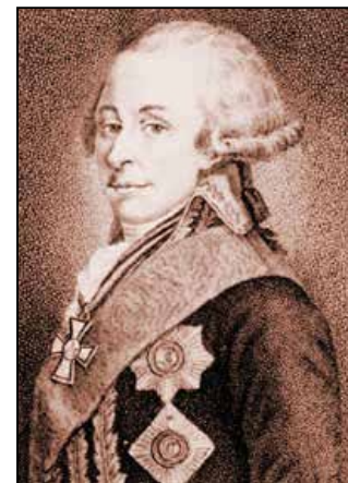
პავლე პოტიომკინი (1743-1796)