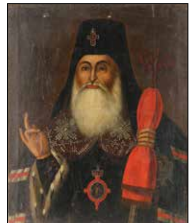
ანტონ I (1720-1788)