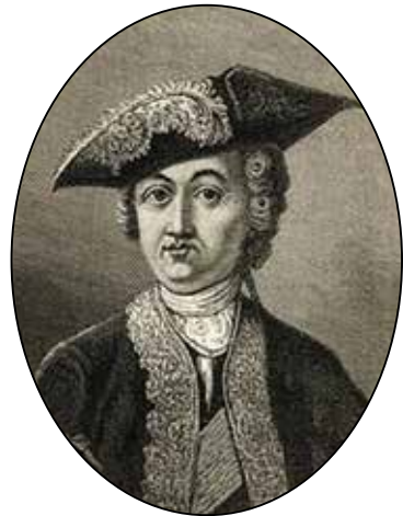
გოტლიბ კურტ ჰაინრის ტოტლებენი (1715-1773)

1738 წელს მოსკოვში ჩავიდა იმერეთის მეფის ალექსანდრე V-ის ელჩი მიტროპოლიტი ტიმოთე გაბაშვილი. ის ცდილობდა არა მარტო სამხედრო-სტრატეგიული, არამედ ეკონომიკური თვალსაზრისითაც დაეინტერესებინა რუსეთი, რამდენიმე მადნის ნიმუშიც ჰქონდა ჩატანილი, მაგრამ ეს ცდაც უშედეგო აღმოჩნდა. რუსეთი ოსმალეთთან ომს, იმერეთის გამო, არ აპირებდა.