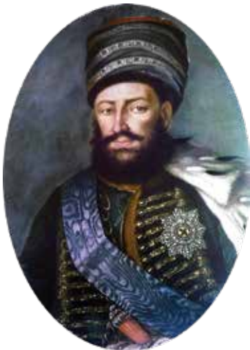
ერეკლე II (1744-1798)

1721 წელს პეტრე I-მა რუსეთი იმპერიად გამოაცხადა. მისმა მომდევნო მეფეებმა დაიწყეს ბრძოლა მიმდებარე ტერიტორიების დაპყრობის ხარჯზე სახელმწიფოს გაფართოებისათვის. ქართველმა მეფეებმაც ისე, რომ არ გაითვალისწინეს ვახტანგ VI-ის დიპლომატიური მარცხის გაკვეთილი, გააგრძელეს ბრძოლა რუსეთთან დასაახლოებლად. განსაკუთრებით აქტიურობდნენ მამა-შვილი თეიმურაზ II და ერეკლე II.