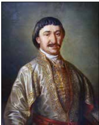
გარსევან ჭავჭავაძე (1757-1811)