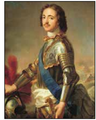
პეტრე I (1682-1725)

XVIII საუკუნის ქართლის გამოჩენილმა მეფემ, ვახტანგ VI-მ, ევროპის ქვეყნების დახმარებით სცადა სპარსეთის აგრესიისგან თავის დაღწევა. მაშინდელ ევროპას საქართველოს გამო სპარსეთთან დაპირისპირება არ სურდა. ამ მიზეზით, ვახტანგის მასწავლებლისა და დიდი ქართველი მწერლის – სულხან-საბას დიპლომატიური მისია ევროპაში 1713-1715 წლებში უშედეგოდ დასრულდა.