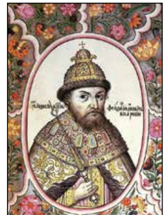
თევდორე ივანეს ძე, რუსთა მეფე (1584-1598)