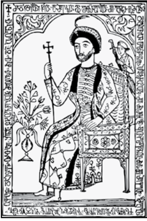
ვახტანგ VI (1675-1737) ქართლის მეფე (1716-1724)