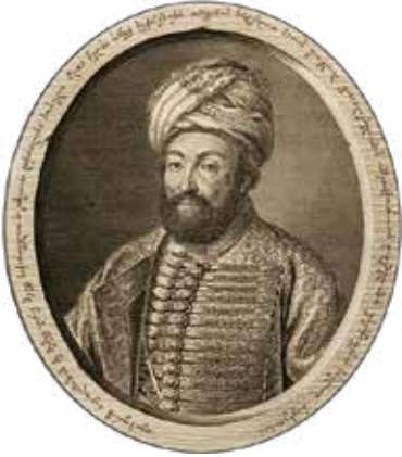
თეიმურაზ II (1744-1762)