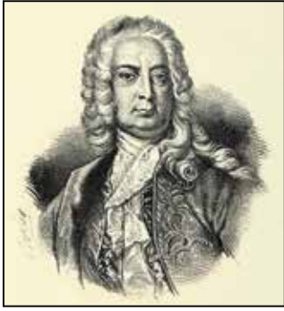
არტემ ვოლინსკი (1689-1740)