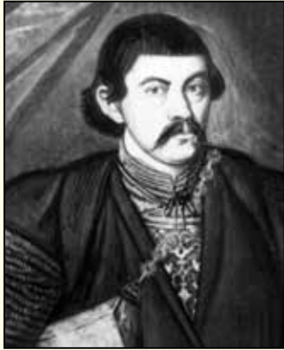
ალექსანდრე არჩილის ძე ბაგრატიონ-იმერეტინსკი (1674-1711)

ალექსანდრე არჩილის ძე ბაგრატიონი, ქართველი ბატონიშვილი, მეფე-პოეტის – არჩილ II-ის ვაჟი. იყო რუსული არმიის პირველი არტილერიის გენერალი, პეტრე I-ის მეგობარი, ტყვედ ჩავარდა შვედეთის ომში და 10 წელი გაატარა იქაურ ციხეში. იცოდა რა პეტრე I-თან ალექსანდრეს სიახლოვე, შვედეთის მეფემ – კარლოს XII-მ მის განთავისუფლებაში რამდენიმე კასრი ოქრო მოითხოვა. პეტრემ ალექსანდრეს თავად მიწერა, გადაეხადა თუ არა შვედეთისთვის ეს დიდი და მძიმე გადასახადი, რაზეც ქართველმა უფლისწულმა ასე უპასუხა: „არათუ სათქმელად, ფიქრადაც არ მომსვლია რაიმე ზარალი მოუვიდეს სახელმწიფოს, არათუ ჩემი განთავისუფლებისა, არამედ იმათი განთავისუფლებისთვისაც კი, რომლებიც ჩემზე ათასკეცად მეტი ღირან. ჩვენ ამისთვის ვართ მოწოდებულნი – ვითმინოთ და მოვკვდეთ სახელმწიფოსა და მამულის ინტერესებისათვის“. „სახელმწიფოსა და მამულში“ ქართველი ემიგრანტი გულისხმობდა რუსეთს, რომელმაც რამდენიმე ათეული წლის შემდეგ მისი ნამდვილი სამშობლო უსამართლოდ დაიპყრო. ტყვე ალექსანდრე ბაგრატიონმა ციხეში რუს გენერლებთან კავშირისთვის საიდუმლო (ქართული) ანბანი გამოიყენა. ალექსანდრე ბაგრატიონი 10 წლის ტყვეობის შემდეგ გაათავისუფლეს, პეტრე მას რიგაში შეეგება, მაგრამ დაავადმყოფებული და დასუსტებული ქართველი უფლისწული გარდაიცვალა. პეტრემ ის გადაასვენა მოსკოვში და დაკრძალეს დონის მონასტერში.