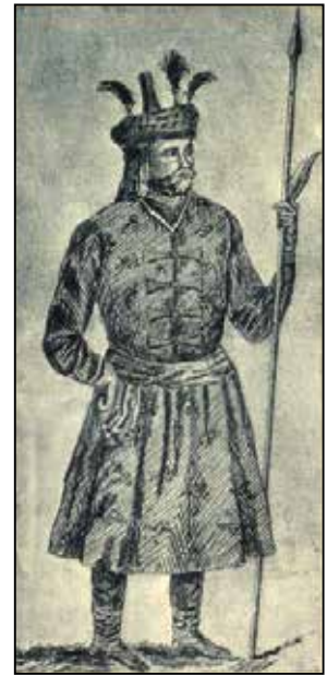
ალექსანდრე II ლევანის ძე, კახთა მეფე (1574-1605)

ურთულესი საგარეო-პოლიტიკური ვითარების პირობებში, სპარსეთის წინააღმდეგ ბრძოლაში თეიმურაზ I-მა სცადა რუსეთთან დიპლომატიური ურთიერთობის განახლება. 1635 წელს მან ელჩები გაგზავნა მოსკოვში და სამხედრო დახმარება ითხოვა. რუსეთიდან მხოლოდ უმნიშვნელო საჩუქრები და დაპირება მოუვიდა. მას რუსეთის მეფისადმი ერთგულების ფიცის დადება მოსთხოვეს. თეიმურაზმა განაახლა ალექსანდრე II-ის „ფიცის წიგნი“. 1653 წელს მან მოსკოვში, ალექსი მიხეილის ძე რომანოვის კარზე, აღსაზრდელად შვილიშვილი ერეკლე გაგზავნა (მას რუსეთში ნიკოლოზ დავითის ძეს უწოდებდნენ). რამდენიმე წლის შემდეგ თავადაც ჩავიდა მოსკოვში, თუმცა, რეალური დახმარება მეფე ალექსისგან ვერ მიიღო. თეიმურაზ I-ის პოლიტიკურმა მემკვიდრეებმაც ვერ შეძლეს სპარსულ-ოსმალური აგრესიის წინააღმდეგ რუსეთის გამოყენება. ამ დროს რუსეთის მთავარ ამოცანად ითვლებოდა ბალტიისპირეთის, დასავლეთ ბელორუსიისა და პოლონეთის, შავი და აზოვის ზღვის სანაპიროების, ყირიმის სახანოს დაპყრობა. ამით ის უპირისპირდებოდა არა მარტო ოსმალეთის იმპერიას, არამედ ევროპის დიდ ქვეყნებსაც.