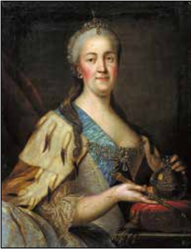
ეკატერინე II (1762-1796)